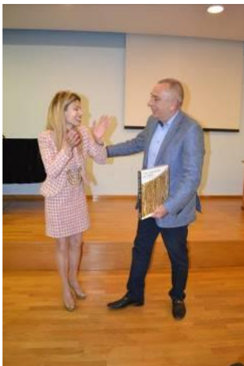
ГРЕЧЕСКИЙ КУЛЬТУРНЫЙ ЦЕНТР Москва, Алтуфьевское шоссе, 44 офис № 9, 2 этаж Тел.: 7084809 – Тел./Факс: 7084810