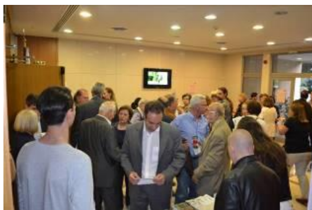
KENTPO EΛΛHNIKOY ΠOΛITISMOY Altufyevskoe shosse, 44, office No 9, 2 nd floor 127566 Moscow, Russia Tel.: +7 495 7084809; Tel./Fax: +7 495 7084810

e-mail: hcc@mail.ru info@hecucenter.ru www.hecucenter.ru skype: hellenic.cultural.center facebook: https://www.facebook.com/Hecucenter/ vkontakte: http://vk.com/hecucenter Instagram: @hecucenter